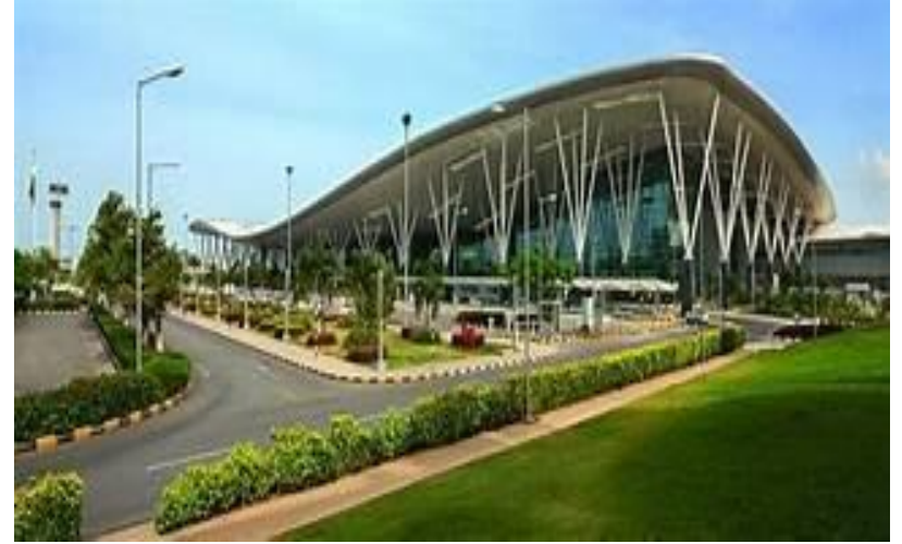
ಅಂತರರಾಷ್ಟ್ರೀಯ ವಿಮಾನ ನಿಲ್ದಾಣ

ಈ ಊರು ಹೊಯ್ಸಳರ ಆಳ್ವಿಕೆಯಲ್ಲೂ ಪ್ರಖ್ಯಾತವಾಗಿತ್ತು. ಶ್ರೀ ವೇಣುಗೋಪಾಲಸ್ವಾಮಿ ದೇವಾಲಯ ಇಲ್ಲಿ ಪ್ರಸಿದ್ಧಿ ಪಡೆದಿದೆ ಮತ್ತು ನಂದಿ ಗಿರಿಧಾಮಕ್ಕೆ ಹೊಂದಿಕೊಂಡಿದೆ.